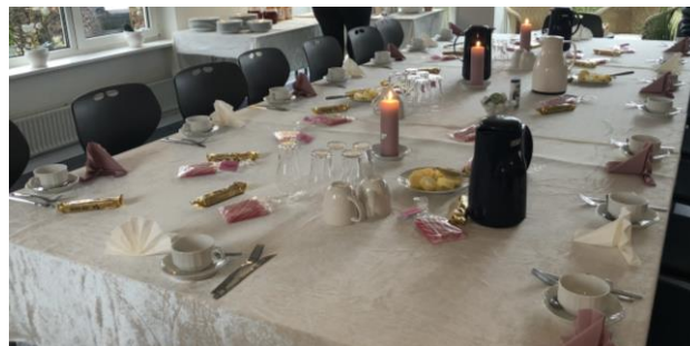
Morgenmadscafé i Dalvænget i Tølløse

I Tølløse er der ikke boligsociale indsatser, og der var ikke madfællesskaber, inden FødevarerBanken trådte ind. Det var her afdelingsbestyrelsen, der via leveringerne fra FødevarerBanken så en mulighed for at igangsætte madfællesskaber for beboerne i området. Samarbejdet med FødevarerBanken var her startskuddet til, at de første aktiviteter blev igangsat. Medlemmerne i afdelingsbestyrelsen gik aktivt ind i arbejdet. Sammen med FødevarerBanken udarbejdede de en plan, udviklede og uddelte materiale om madfællesskaber i området. Der blev igangsat fire forskellige madfællesskaber over den første måned med 10-20 deltagere hver gang: Fællesspisning, formiddagscafé, eftermiddagscafé og morgenmadscafé. De beboere, der deltog, var primært ældre. De giver udtryk for at være glade for, at der etableres madfællesskaberne i området. Herved oplever de, at de får mulighed for at lære andre beboere bedre at kende og samtidig få et godt måltid mad.