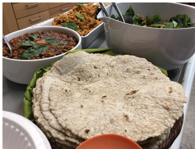
Damernes Café i Karlemoseparken i Køge

Madfællesskabet kommer bl.a. kvinder, der er enlige, ældre eller arbejdsledige med forskellige etniske baggrunde, til gode. Beboerne fortæller, at de hygger sig lidt ekstra ved at kunne dufte madlavningen, tale om og glæde sig til maden serveres, mens der arbejdes med de kreative sysler.