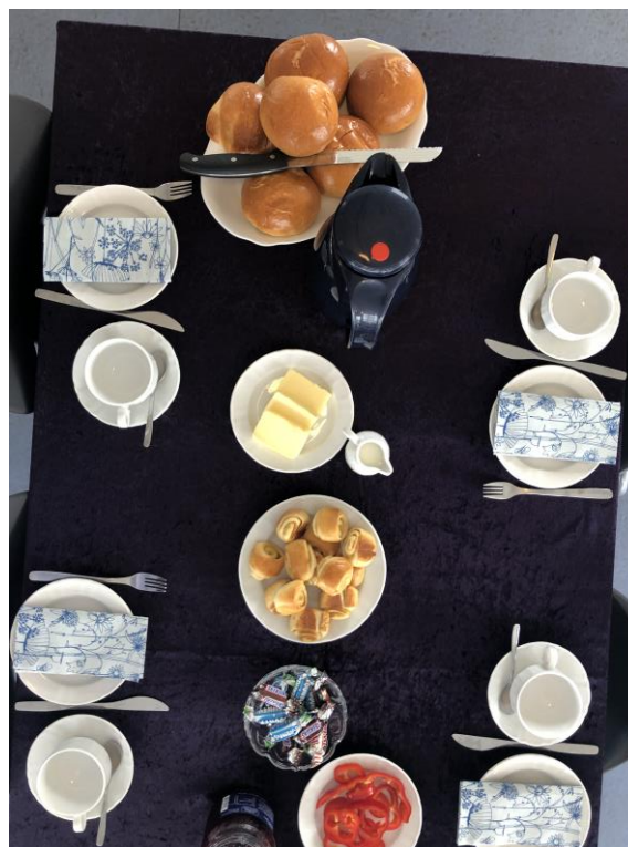
Morgenmadscafé i Tølløse

En vigtig pointe er, at det vil skulle vurderes, hvordan madfællesskaber kan komme op at stå i et konkret boligområde, som indgår i samarbejder med FødevarerBanken. Det er nemlig væsentligt at have for øje, at der i de tre boligområder er forskellige forudsætninger for at etablere madfællesskaber. Og dermed også for at kunne arbejde med de virkemidler, som evalueringen illustrerer.