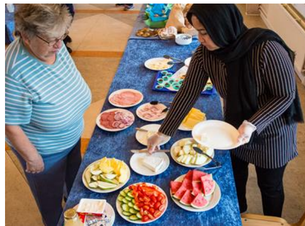
Morgenmadscafé i Karlemoseparken i Køge

Det, at mødes og spise med andre, har både betydning for beboernes trivsel, og det støtter også op om sammenhængskraften i området, når beboere møder hinanden gennem en aktivitet i boligområdet.