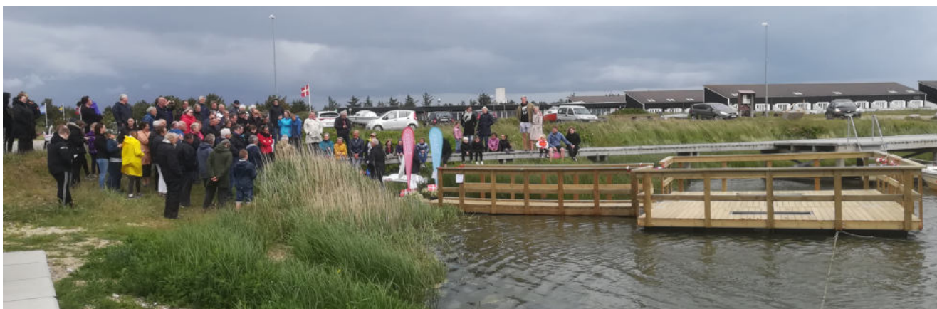
Den mobile opdagelsesplatform i Agger Havn skaber offentlig adgang for alle inkl. kørestolsbrugere.