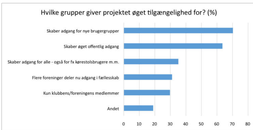
Figur 1: Projekternes besvarelse af spørgsmål om "Hvilke grupper giver projektet øget adgang til?" (n=77).

Som det ses i figur 1, skaber projekterne især adgang for nye brugergrupper (70 %) og øget offentlig adgang (64 %). Godt en tredjedel (35 %) skaber tilgængelighed for alle herunder fx kørestolsbrugere m.m. Knap en tredjedel (31 %) har øget tilgængeligheden ved, at flere foreninger nu deler adgang i fællesskab, mens det for 30 % kun er kommet øget tilgængelighed for klubbens eller foreningens egne medlemmer. Herudover nævner 19 % andet, som ofte er en uddybelse af hvilke grupper, der får øget adgang, eksempelvis naboklubben, roere, turister osv.