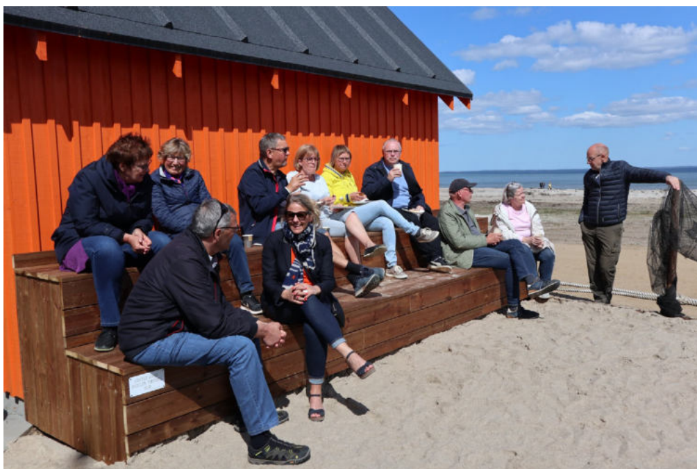
I Hejlsminde Strandpark er der etableret fire småhuse og en samværsplads, som inviterer alle ind.

Information og synliggørelse er en forudsætning for, at folk opdager og benytter de nye faciliteter og oplevelsesmuligheder, der bl.a. skabes gennem projekterne. Det kan ske gennem mange kanaler som fx pressen, på de sociale medier og i alle relevante Facebook grupper lokalt og nationalt. Omtale i lokalaviser når også ud til mange i lokalområdet. Det kan også være at invitere folk ind til selv at prøve, som et projekt nævner: "Hvis tilgængelighed også kan betyde mulighed for, at folk frit kan prøve en foreningsaktivitet, så har vi et råd: Synlighed, synlighed, synlighed."