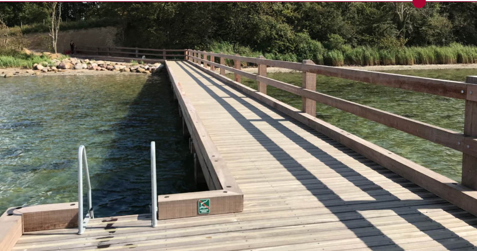
Tilgængelighed til friluftsfaciliteter er vigtig, og denne handicapvenlige fiskebro er etableret ved Det marine Center, Kær Vestermark i Sønderborg Kommune.