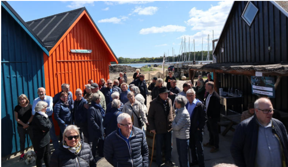
Fællesskaber er omdrejningspunktet for etableringen af fire småhuse og samværspladsen i Hejlsminde Strandpark.