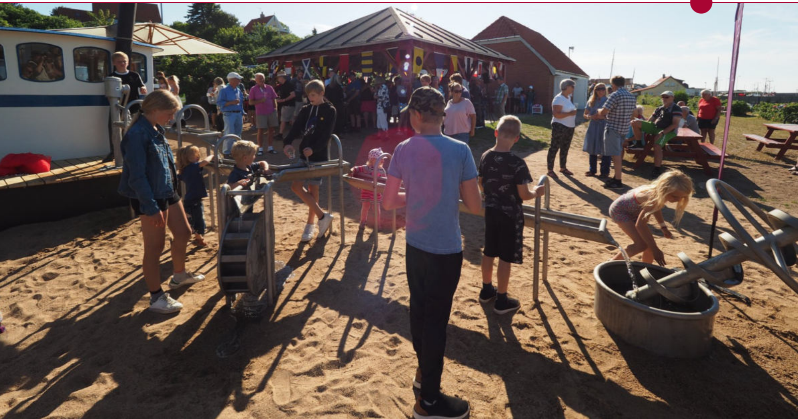
Vandeksperimentariet i Odden Havn har i fællesskab arbejdet meget på at fundraise gennem arrangementer til gennemførelse af deres projekt, der nu er åbent for alle.